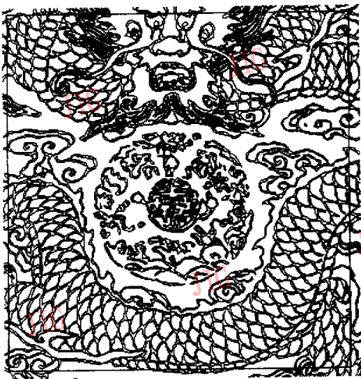
图 4 转化后的效果(局部)

处理这幅图所用时间为 3min. 转换后,效果如图 4 所示(局部放大的部分,矩形框中的部分与上图矩形框中的部分对应).